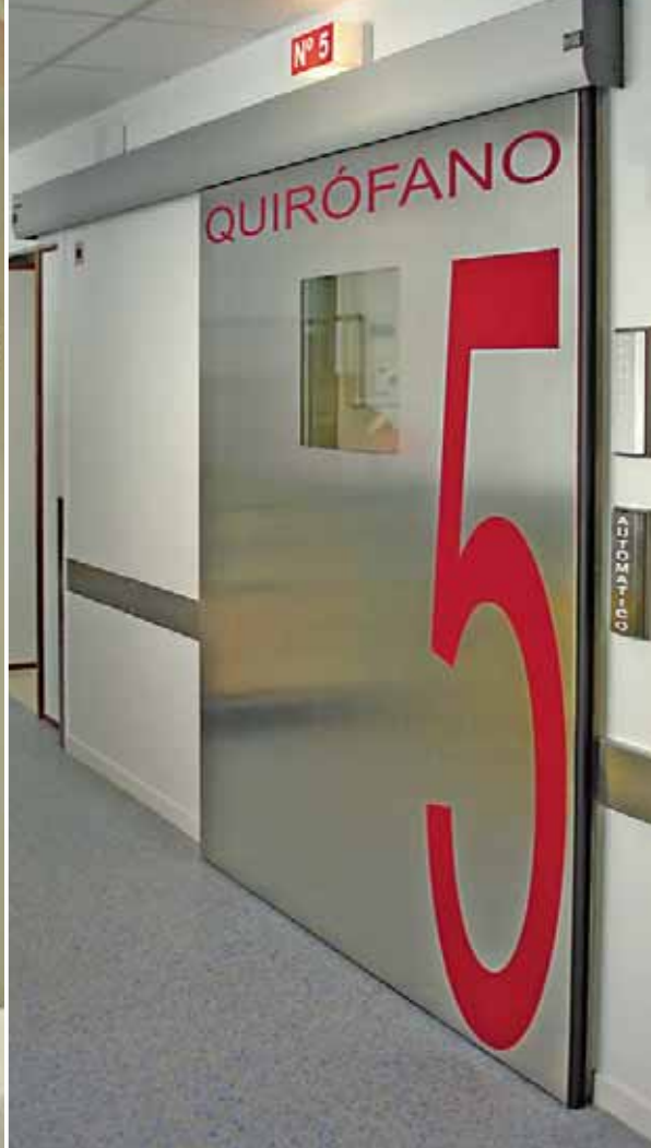
► Puertas para quirófanos