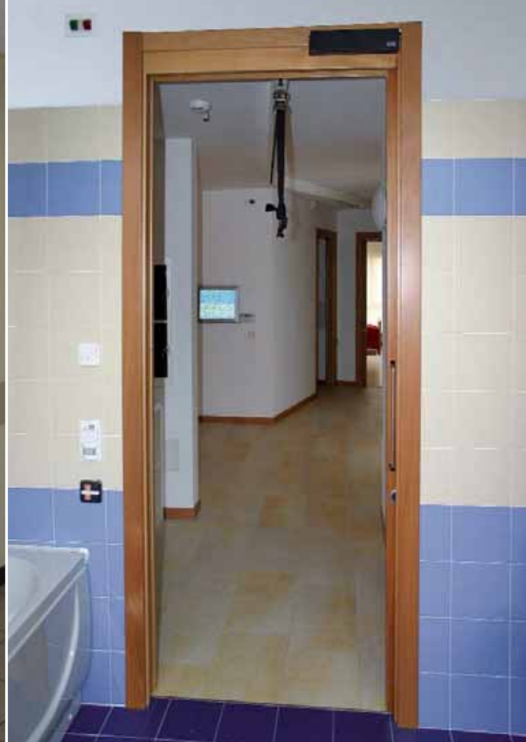
► Puertas batientes o correderas para ayudar a las personas con problemas de movimiento