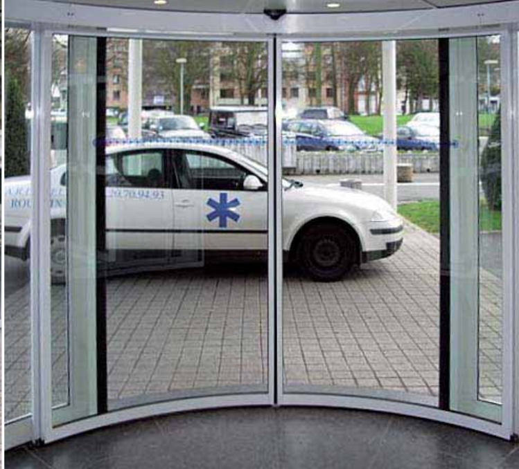
► Puertas de entrada correderas, curvas y giratorias