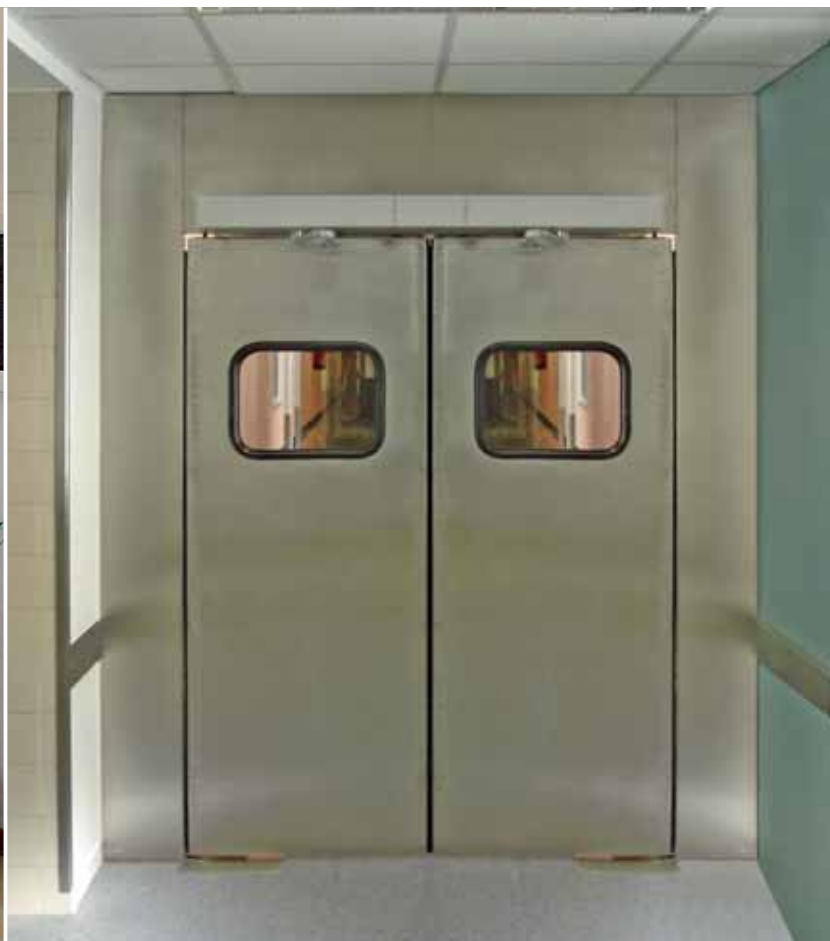
► Automatismos para puertas batientes y batientes cortafuegos con automatismo WEL F